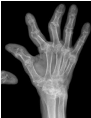
X-Ray of diseased hand.