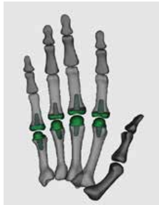
Digitales Modell zur Simulation der Gelenkbewegungen.