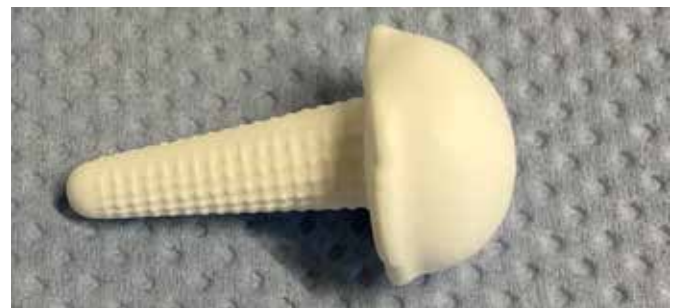
Gegossenes patientenspezifisches Fingergelenkimplantat aus ATZ.

Für Anwendungen in der Medizintechnik bietet das Fraunhofer IKTS die kundenspezifische Entwicklung von oxidkeramischen Komponenten und Technologien sowie die kundenspezifische Fertigung von Halbfabrikaten an. Hierfür sind wir nach DIN EN ISO 13485 zertifiziert.