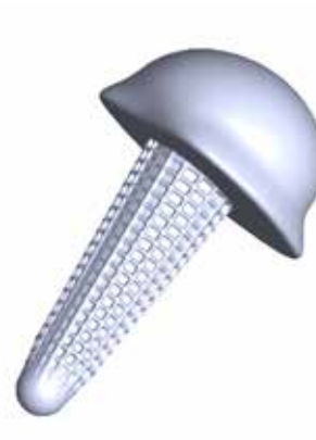
Patient-specific design generated by AI.