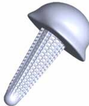
KI-generiertes patientenspezifisches Implantat.