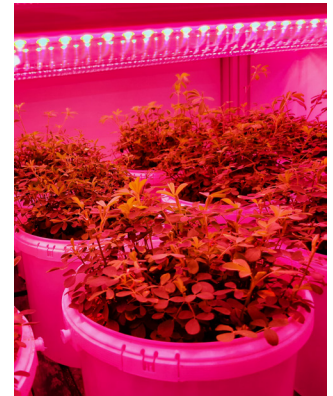
Standardized nutrient availability tests.