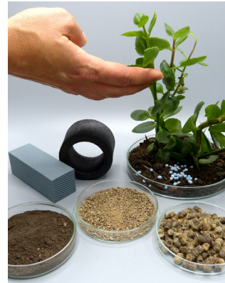
Sewage sludge ashes can be used as fertilizer.