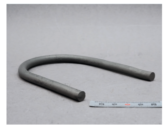
Abb. 2: Gebogener ZrC-Heizer.