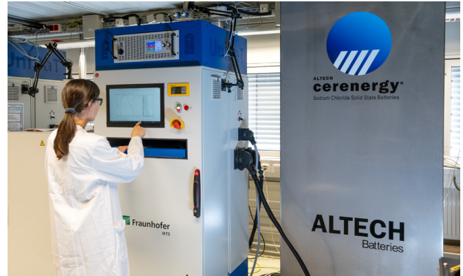
60 kWh cerenergy®-battery prototype testing.