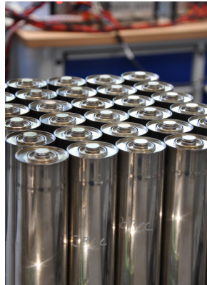
100 Ah Batteriezellen.