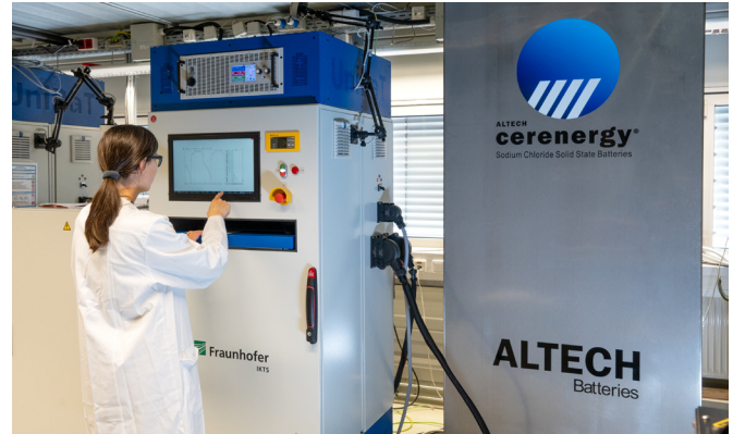
60 kWh cerenergy®-Batterie-Prototyp im Test.