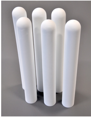
Ceramic solid electrolytes.