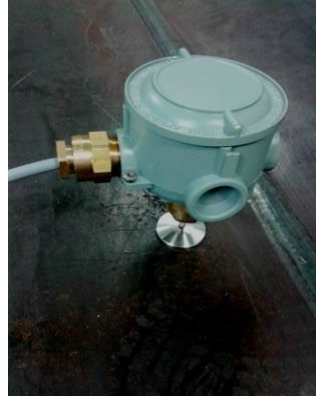
CoMoSens for welded seam monitoring.