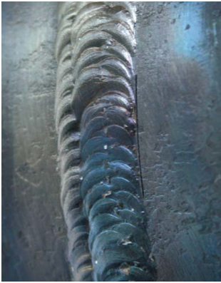
Typical defect size and orientation ( l = 20 mm; w = 0.1 mm; h = 1 \dots 10 mm).