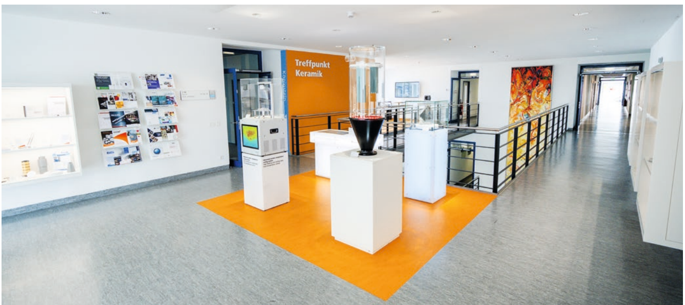
Treffpunkt Keramik im Fraunhofer IKTS in Dresden-Gruna.

Am IKTS-Standort Hermsdorf wurde im März 2024 ein weiterer »Treffpunkt Keramik« eingeweiht. In vier Vitrinen werden Exponate aus den Forschungsschwerpunkten des Standorts Oxidkeramik, Funktionskeramik, Batterie- sowie Membrantechnologie gezeigt.